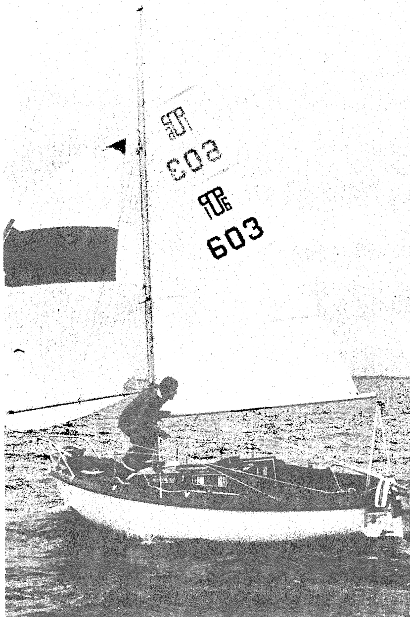
POP 16:2 är en av marknadens billigaste segelbåtar med kojplatser för en familj. Klarar den proven för att godkännas för segling utomskärs?

OXSS träning börjar tisdagen den 3.10 kl. 19.00 i Torgskolans gymnastiksal. Uppgjord för alla stadier och åldrar.